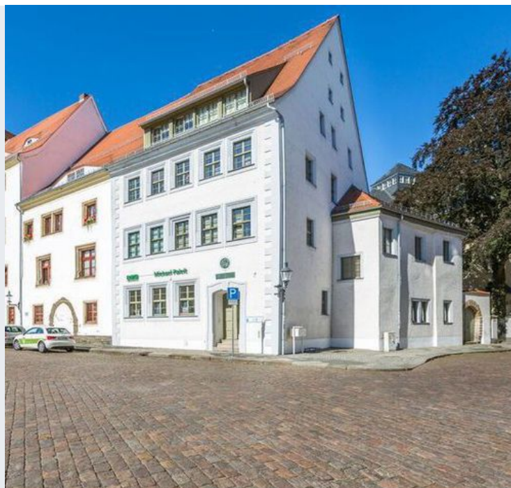
Ansicht vom Untermarkt

Kleine Büroeinheit in der Freiburger Altstadt zu vermieten. Die Räume befinden sich im Erdgeschoss und sind in einem guten Zustand. Vereinbaren Sie schnell einen Besichtigungstermin!