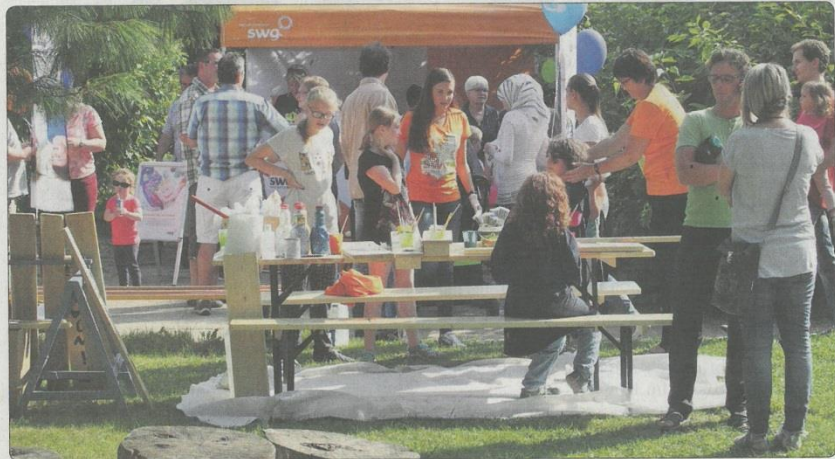
Zum Friedeburgfest ist für jeden Besucher etwas dabei.

Wir freuen uns auf zahlreiche Besucher. Der Eintritt ist kostenfrei. Für Essen und Trinken ist gesorgt.